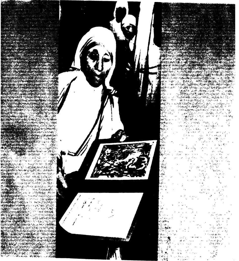
नोबल पुरस्कार प्राप्त गरेपछि मदन टेरेजा